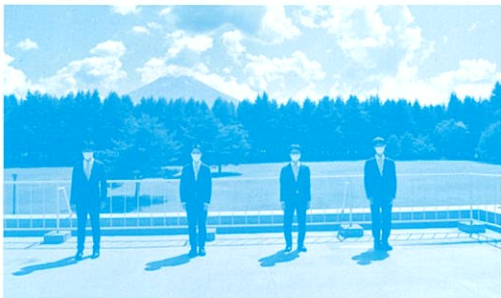
IBO Challenge II 2021に出場した日本代表(2021年7月)

なお、いくつかの大学では、日本生物学オリンピックでの成績が入学試験で考慮されることがあります。(JBO のウェブページ参照)